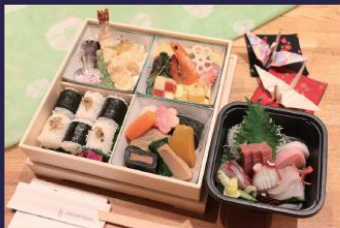
② 本格和食弁当 4,000 円 (税込)