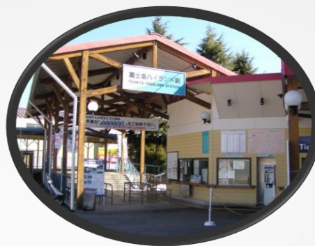
富士急ハイランド駅

新宿からは、乗り換えなし1時間53分で行ける 特急電車「 富士回遊 」 バスタ新宿からの高速バスも出ております。