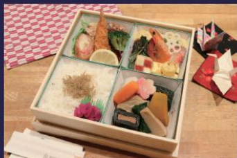
① 本格和食弁当 3,000 円 (税込)