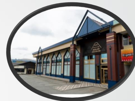
ハイランド ステーションイン